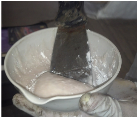
Figura 2. Mortero Realizado con Resina y Cal