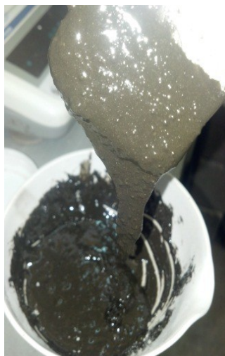
Figura 6. Mortero Realizado con Resina y Arcilla Húmeda