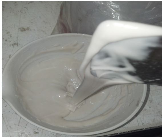
Figura 3. Mortero Realizado con Resina y Calcita

Las características que contiene esta dosificación son las que se muestran en la Tabla 4: