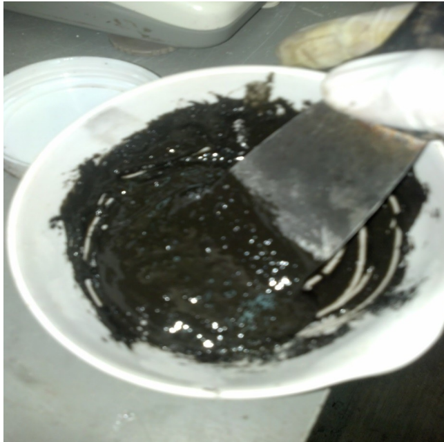
Figura 4. Realizado con Resina y Cemento Portland

A continuación se muestra la Tabla 5 mostrando las características de esta dosificación.