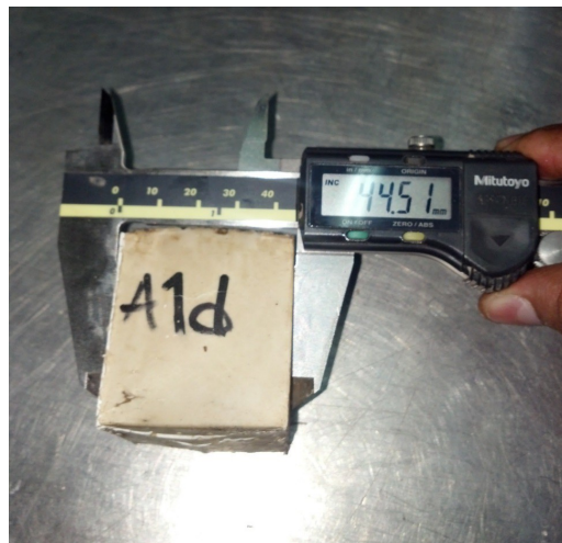
Figura 8. Deformación de 6 mm la probeta después de ser ensayada a compresión, esta originalmente tenía 50.00 mm

En la Figura 6 se muestra que este material puede llegar a tener una diferencia de altura de 6 mm aproximadamente (cada probeta es de 5 × 5 × 5 cm) sin llegar a fracturarse por completo, este resultado no es la carga constante que se muestra en la Figura 8 ya que después de que apareció su primer grieta se le continuo aplicando carga y esta tiende a tener una resistencia residual del 10% más al primer agrietamiento hasta llegar a tener esta deformación.