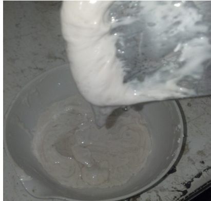
Figura 5. Realizado con Resina y Yeso

Las características que contiene esta dosificación son las que se muestran en la siguiente Tabla 6.