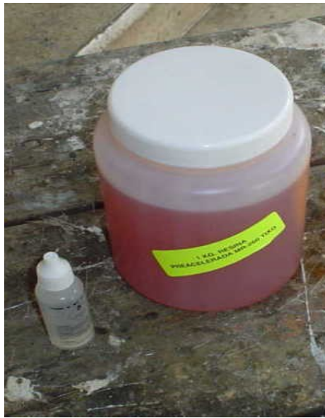
Figura 1. Resina Utilizada para la elaboración del Mortero-Reparador

La resina utilizada fue; 1834-PCS-12 (ver Figura 1) de ACC/MEXICANA de RESINAS S.A. de C. V. es una resina poliéster ortoftálica modificada, preacelerada y de reactividad alta.